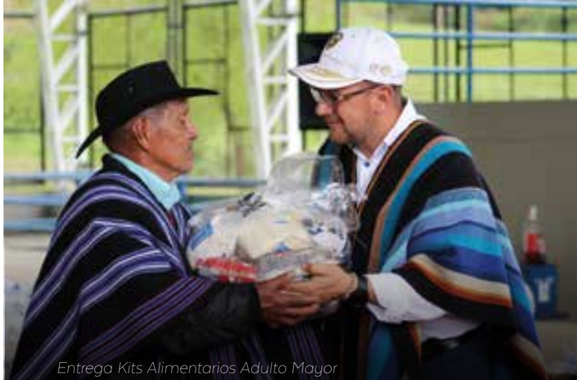
Entrega Kits Alimentarios Adulto Mayor