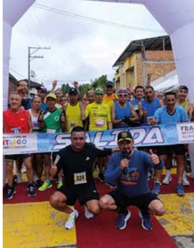
Carrera Atletica 10K Santiagomanda