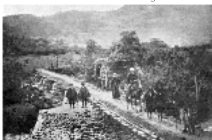
Puente de mampelone sobre el río Quinchoa. Entre Santiago y San Andrés. Construido por los Ingas.