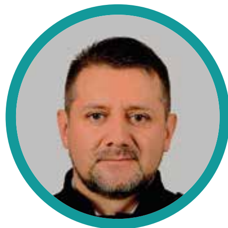
Alcalde del municipio de Santiago, Franklin Benavides Revelo

Han ejercido por más de 10 años como burgomaestre municipal en sus tres mandatos populares, en donde cada periodo demuestra su capacidad de gestión y experiencia, recursos del orden nacional, departamental, municipal y de cooperación internacional, engalanan con inversión en obras de gran impacto en la calidad de vida de los habitantes de este bello municipio. El mandatario siempre insiste en el firme compromiso del bienestar de la comunidad santiagueña, su gestión se ha caracterizado por la planeación estratégica, la eficiencia administrativa y la ejecución de proyectos de gran impacto.