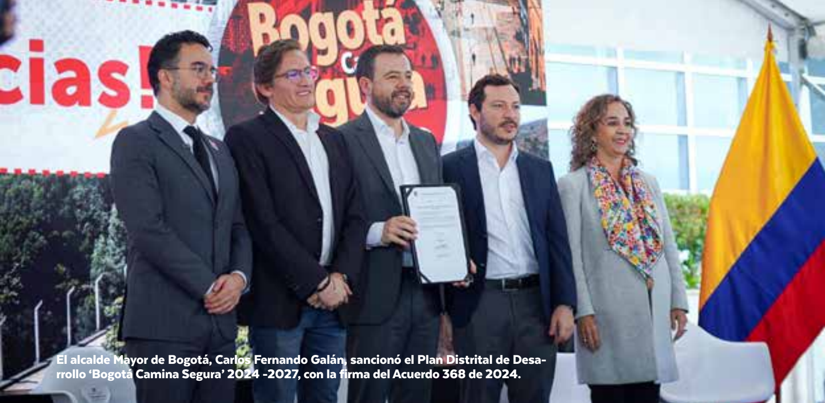
El alcalde Mayor de Bogotá, Carlos Fernando Galán, sancionó el Plan Distrital de Desarrollo 'Bogotá Camina Segura' 2024 -2027, con la firma del Acuerdo 368 de 2024.

todo tipo de públicos y en horarios poco habituales para este tipo de actividades. Entre ellas se incluyen conciertos, talleres, recorridos turísticos, ferias, festivales, eventos comunitarios y horarios extendidos en museos, entre otras acciones realizadas durante el último año. De esta manera, Bogotá busca ampliar el acceso a la cultura y dinamizar la economía del sector.