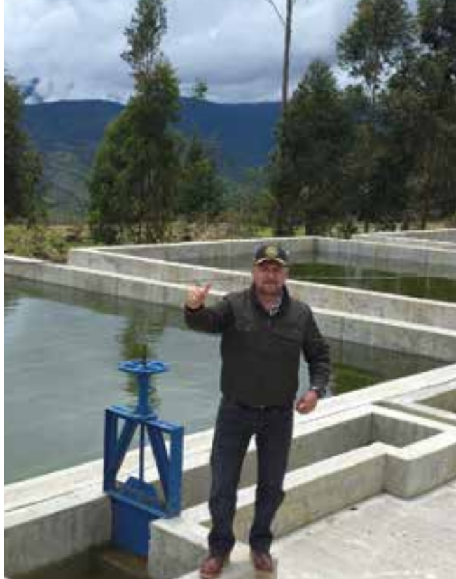
Nuevo Sistema de Acueducto Urbano