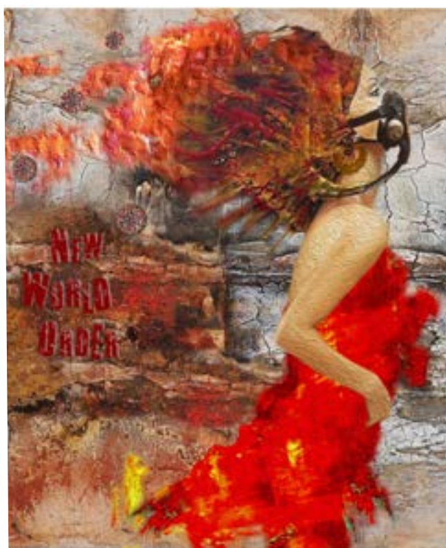
Pandemia Nuevo Orden Mundial

Cargas Matericas Mixtas Oleo sobre lienzo, pigmentos y tintas