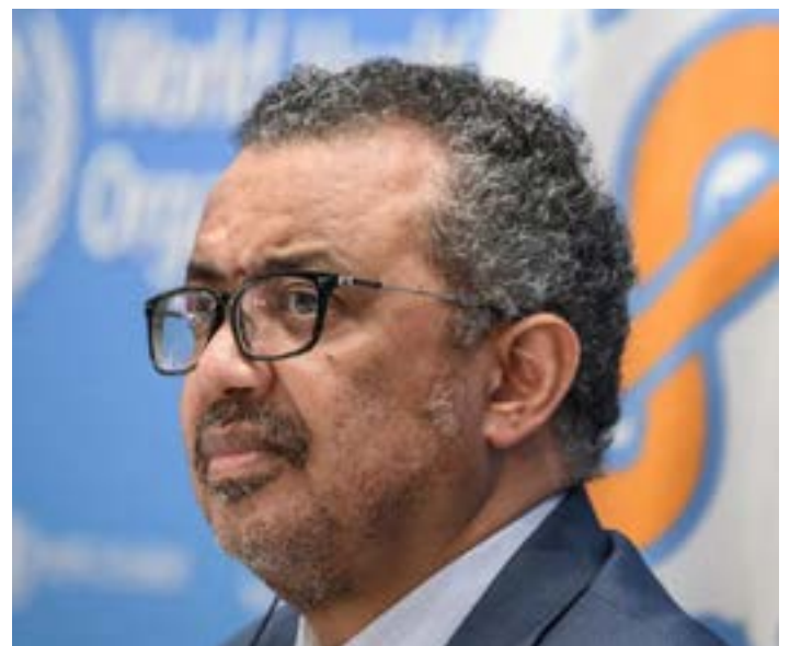
Tedros Adhanom. Director General OMS

De igual forma, las autoridades sanitarias de Italia notificaron el pasado lunes, la aparición de dos casos sospechosos en Lombardía, pertenecientes a miembros de dos familias que habían regresado recientemente de Uganda, con fiebre de 38 grados y síntomas gastrointestinales, quienes ya se encuentran bajo vigilancia sanitaria.