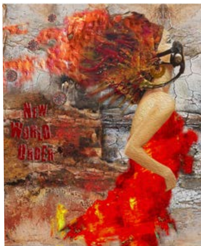
Pandemia Nuevo Orden Mundial

Cargas Matericas Mixtas Oleo sobre lienzo, pigmentos y tintas