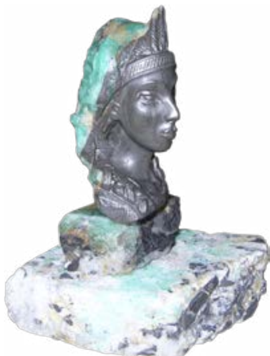
Princesa Muisca Técnica: Talla en Ganga de Esmeralda Dimensiones: 8 x 4 x 2,5 cms Autor: Jorge Torres Gómez