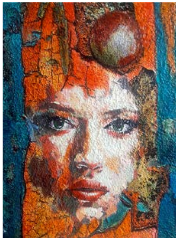
De la Serie S.O.S. Madre Tierra

Cargas Matericas Mixtas Oleo sobre lienzo, pigmentos y tintas