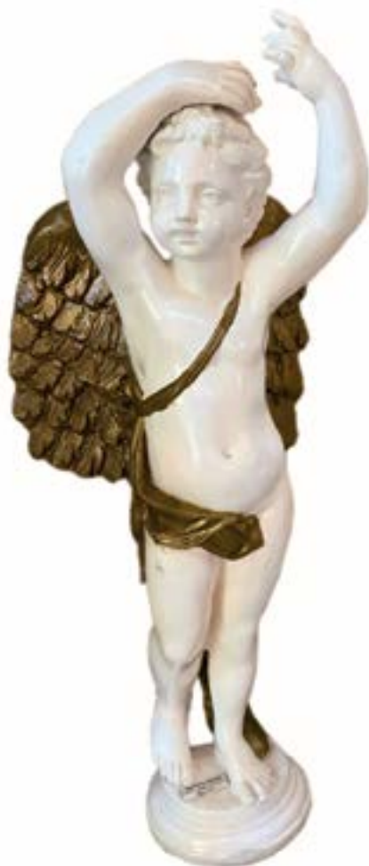
Escultura Angel 1 Técnica: Resina de Mármol Dimensiones: 80 x 45 x 25 cms Autor: Jorge Torres Gómez