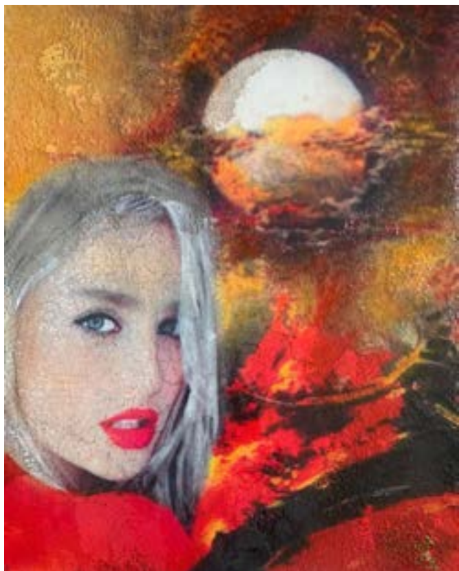
Lady en Miami

Obra Colección privada Museo de valija Iberoamericana Sevilla España