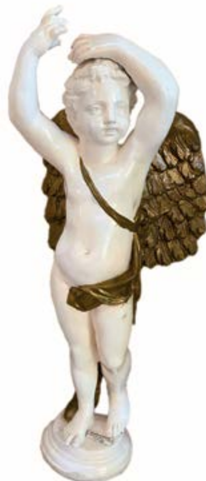
Escultura Angel 2 Técnica: Resina de Mármol Dimensiones: 80 x 45 x 25 cms Autor: Jorge Torres Gómez