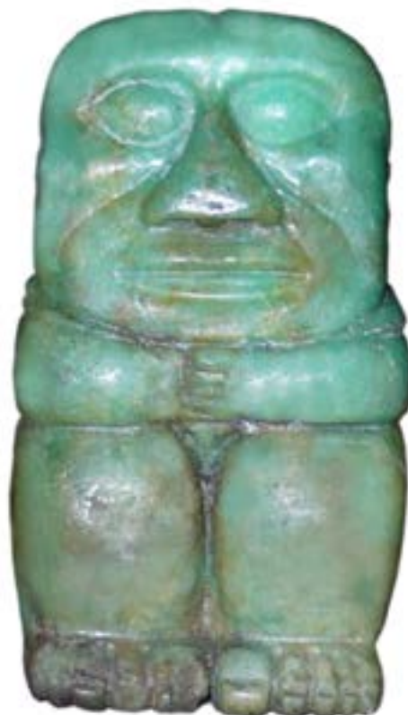
San Agustín y Tierradentro Técnica: Talla en Ganga de Esmeralda Dimensiones: 20 x 10 x 7 cms Autor: Jorge Torres Gómez