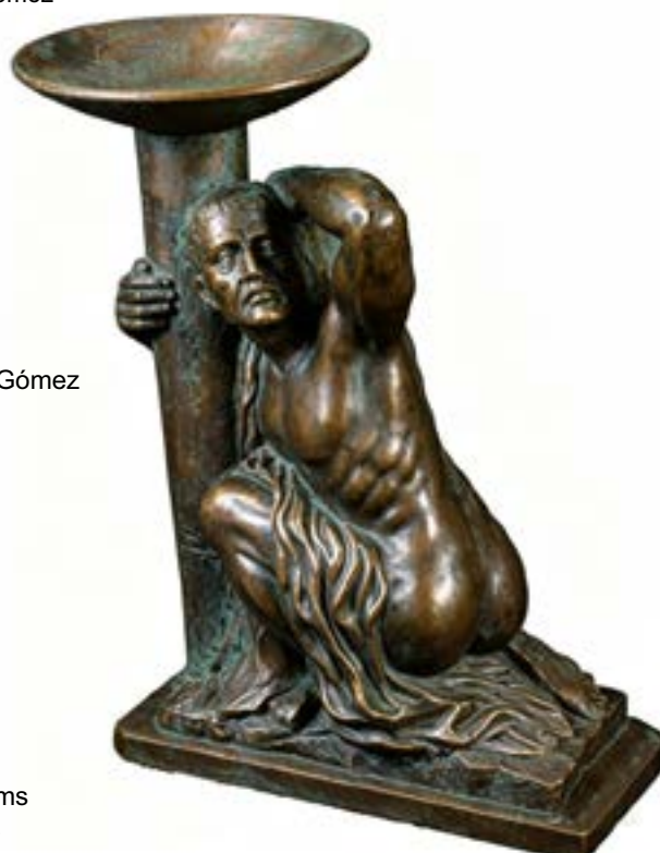
Rescate Cultural Técnica: Bronce Dimensiones: 40 x 20 x 12 cms Autor: Jorge Torres Gómez