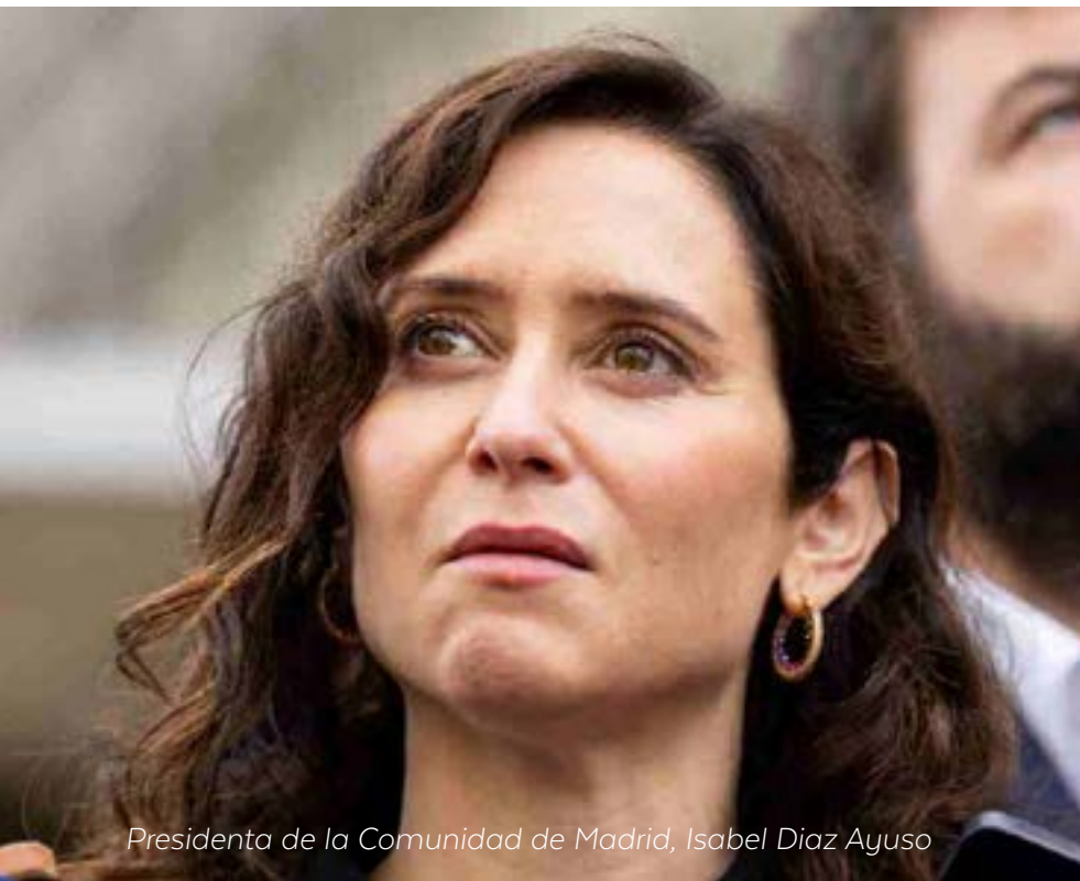
Presidenta de la Comunidad de Madrid, Isabel Díaz Ayuso