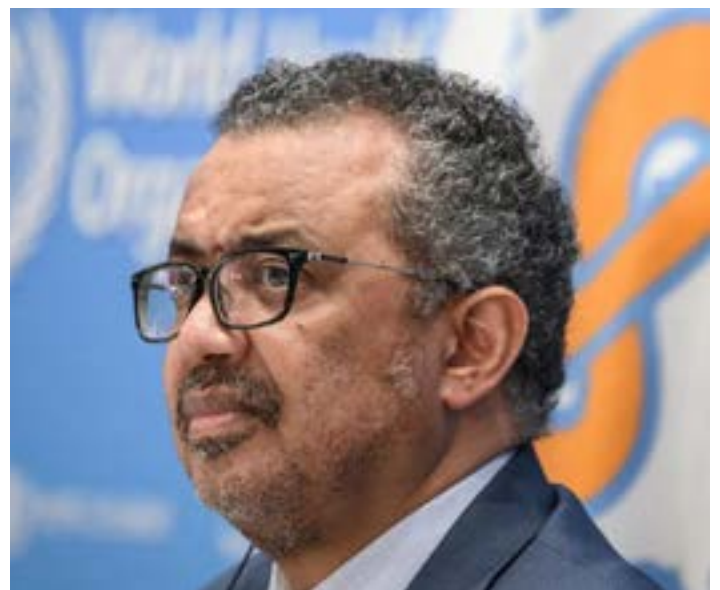
Tedros Adhanom. Director General OMS

De igual forma, las autoridades sanitarias de Italia notificaron el pasado lunes, la aparición de dos casos sospechosos en Lombardía, pertenecientes a miembros de dos familias que habían regresado recientemente de Uganda, con fiebre de 38 grados y síntomas gastrointestinales, quienes ya se encuentran bajo vigilancia sanitaria.