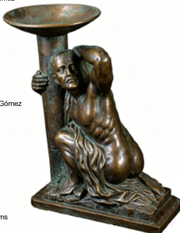
Rescate Cultural Técnica: Bronce Dimensiones: 40 x 20 x 12 cms Autor: Jorge Torres Gómez