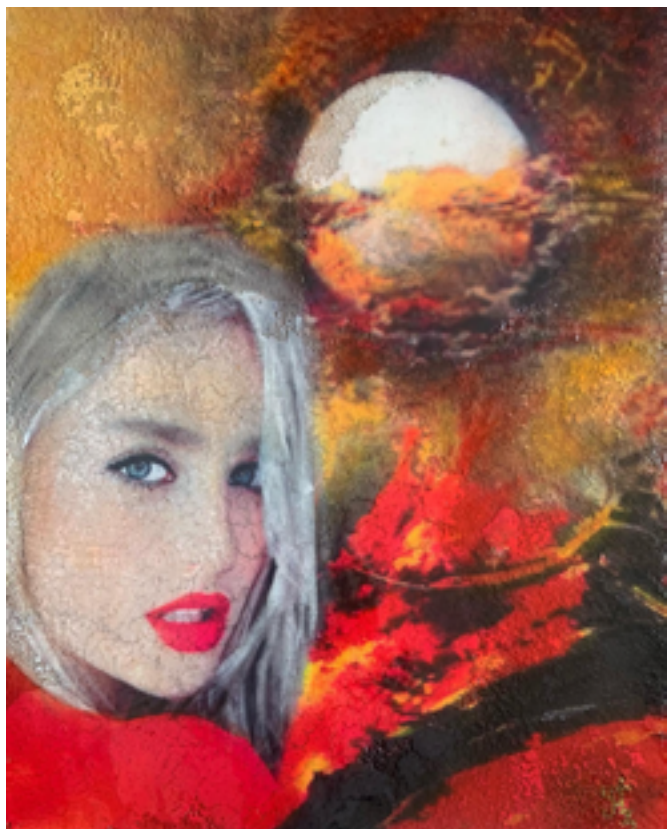
Lady en Miami

Obra Colección privada Museo de valija Iberoamericana Sevilla España