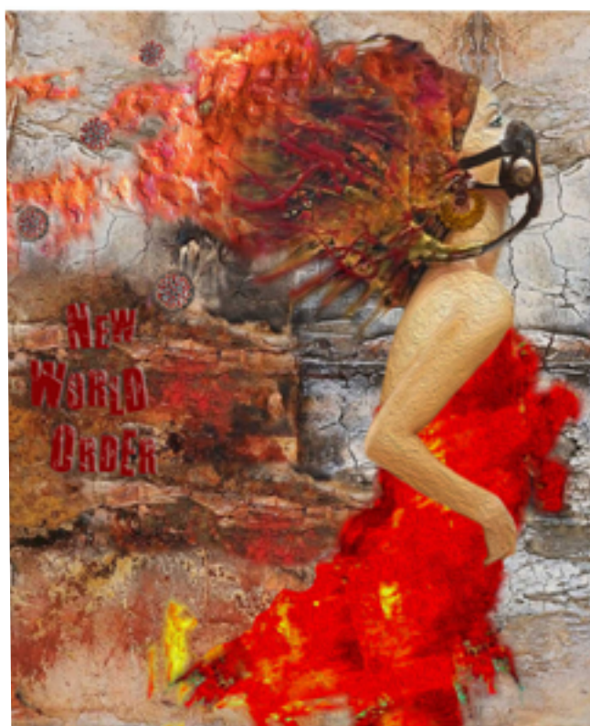
Pandemia Nuevo Orden Mundial

Cargas Matericas Mixtas Oleo sobre lienzo, pigmentos y tintas