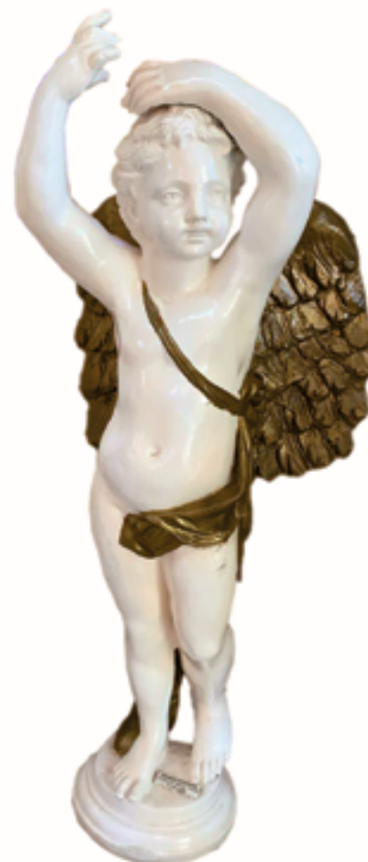
Escultura Angel 2 Técnica: Resina de Mármol Dimensiones: 80 x 45 x 25 cms Autor: Jorge Torres Gómez