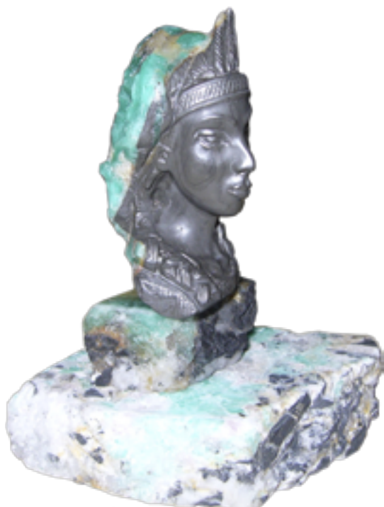
Princesa Muisca Técnica: Talla en Ganga de Esmeralda Dimensiones: 8 x 4 x 2,5 cms Autor: Jorge Torres Gómez