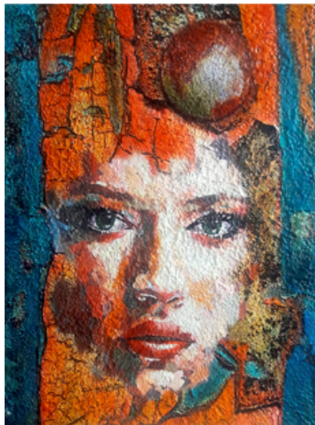
De la Serie S.O.S. Madre Tierra

Cargas Matericas Mixtas Oleo sobre lienzo, pigmentos y tintas