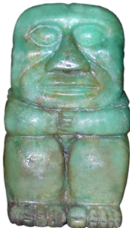
San Agustín y Tierradentro Técnica: Talla en Ganga de Esmeralda Dimensiones: 20 x 10 x 7 cms Autor: Jorge Torres Gómez